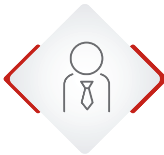
Agente Generali Italia