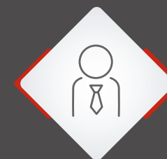
Agente Generali Italia