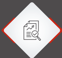
Risk Assessment tecnico-artistico

Il percorso ARTE Generali proporrà una soluzione assicurativa specifica con: