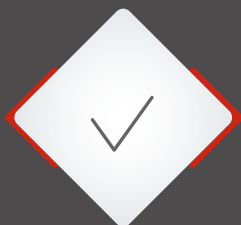
Consulenza mitigazione rischi

Il percorso ARTE Generali proporrà una soluzione assicurativa specifica con: